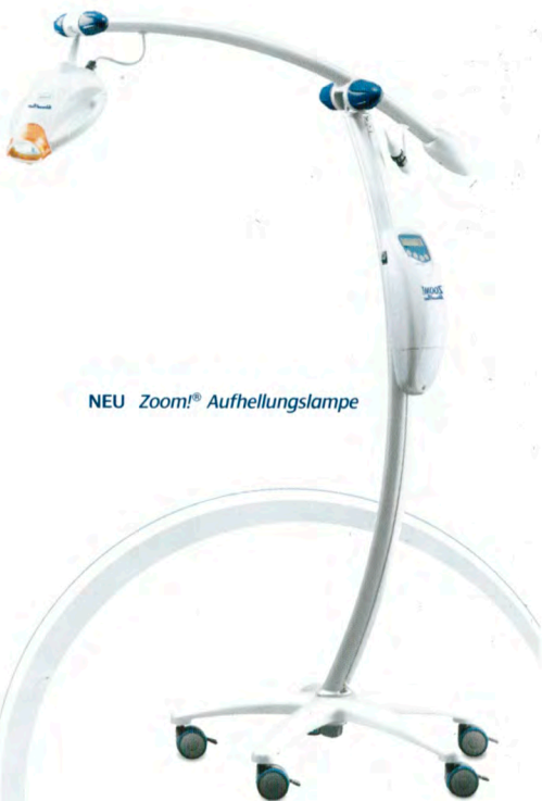
NEU Zoom! ® Aufhellungslampe

A: Während der Behandlung kann der Patient bequem fernsehen oder Musik hören. Für sehr ängstliche Personen oder solche mit starkem Würgereflex könnte die Dauer der Behandlung ein Problem darstellen. Dies sollte vor der Behandlung mit dem Zahnarzt/der Zahnärztin besprochen werden.